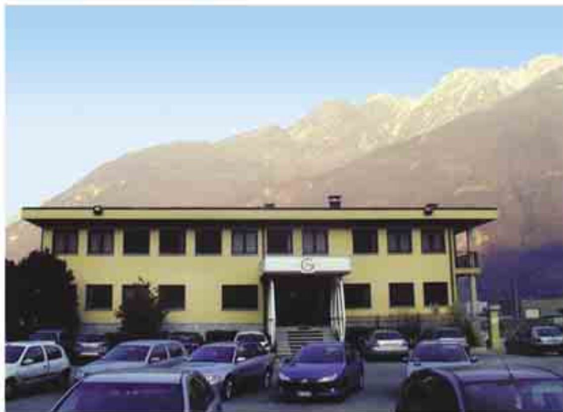
GRANITO BIANCO DI BAVENO